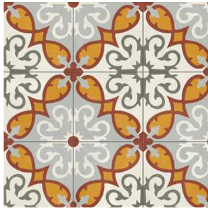
Altea Elda Natural 59,2x59,2 cm - 23,3"x23,3"