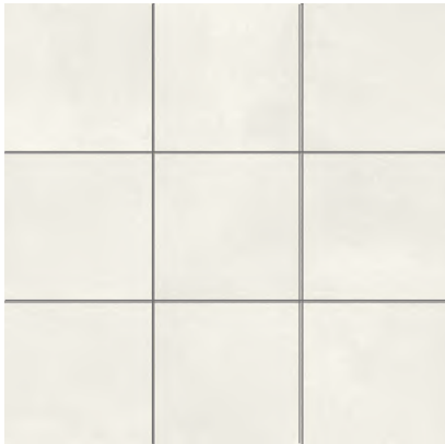
Altea Puerto Natural 59,2x59,2 cm - 23,3"x23,3"