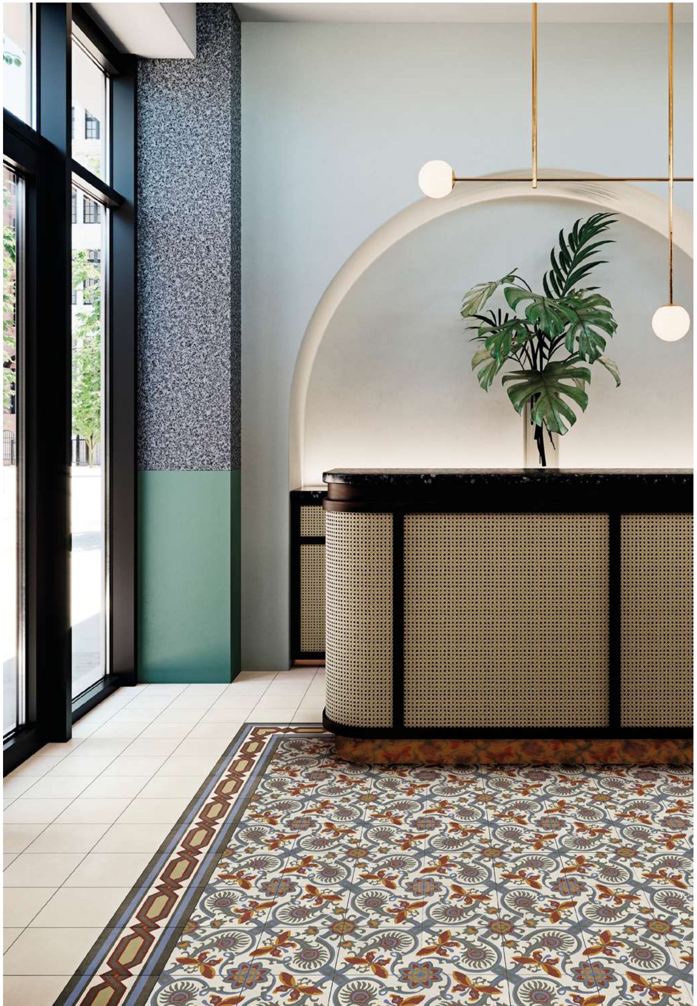
Floor: Altea Puerto_Puerto Frieze_Puerto Corner_Alba Natural 59,2x59,2 cm