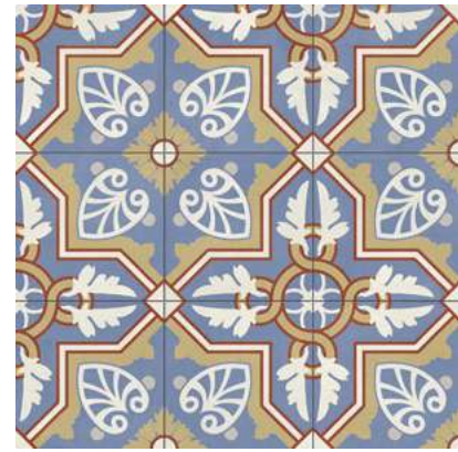
Altea Pinar Natural 59,2x59,2 cm - 23,3"x23,3"