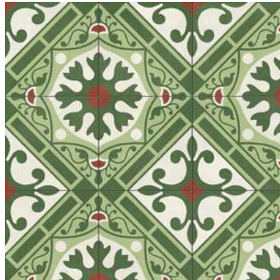
Altea Corbeta Natural 59,2x59,2 cm - 23,3"x23,3"