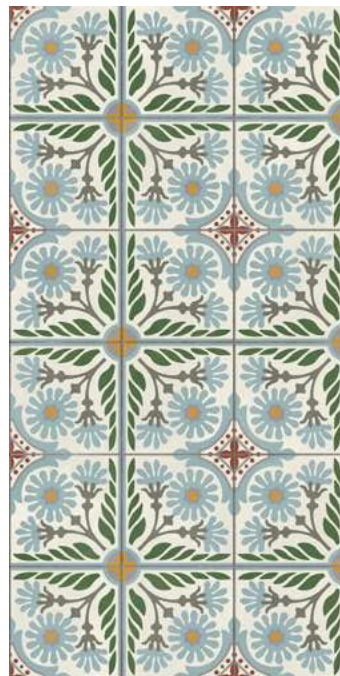
Altea Olivo Outdoor 2CM 49,75x99,55 cm - 19,59"x39,19"