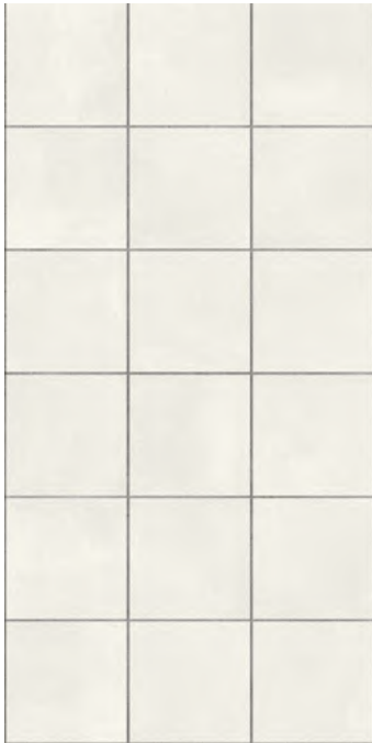
Altea Puerto Outdoor 2CM 49,75x99,55 cm - 19,59"x39,19"