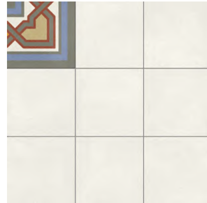
Altea Puerto Corner Natural 59,2x59,2 cm - 23,3"x23,3"