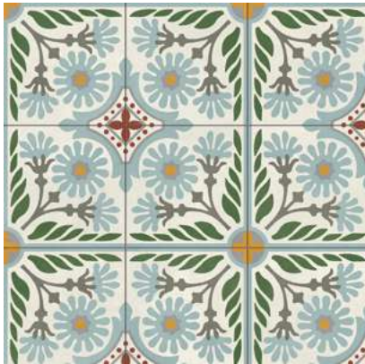
Altea Olivo Natural 59,2x59,2 cm - 23,3"x23,3"