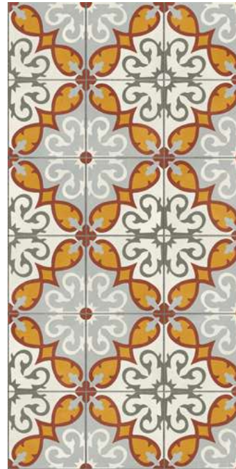
Altea Elda Outdoor 2CM 49,75x99,55 cm - 19,59"x39,19"