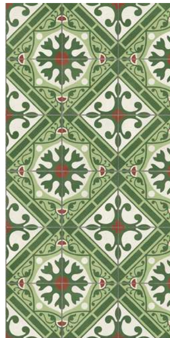
Altea Corbeta Outdoor 2CM 49,75x99,55 cm - 19,59"x39,19"