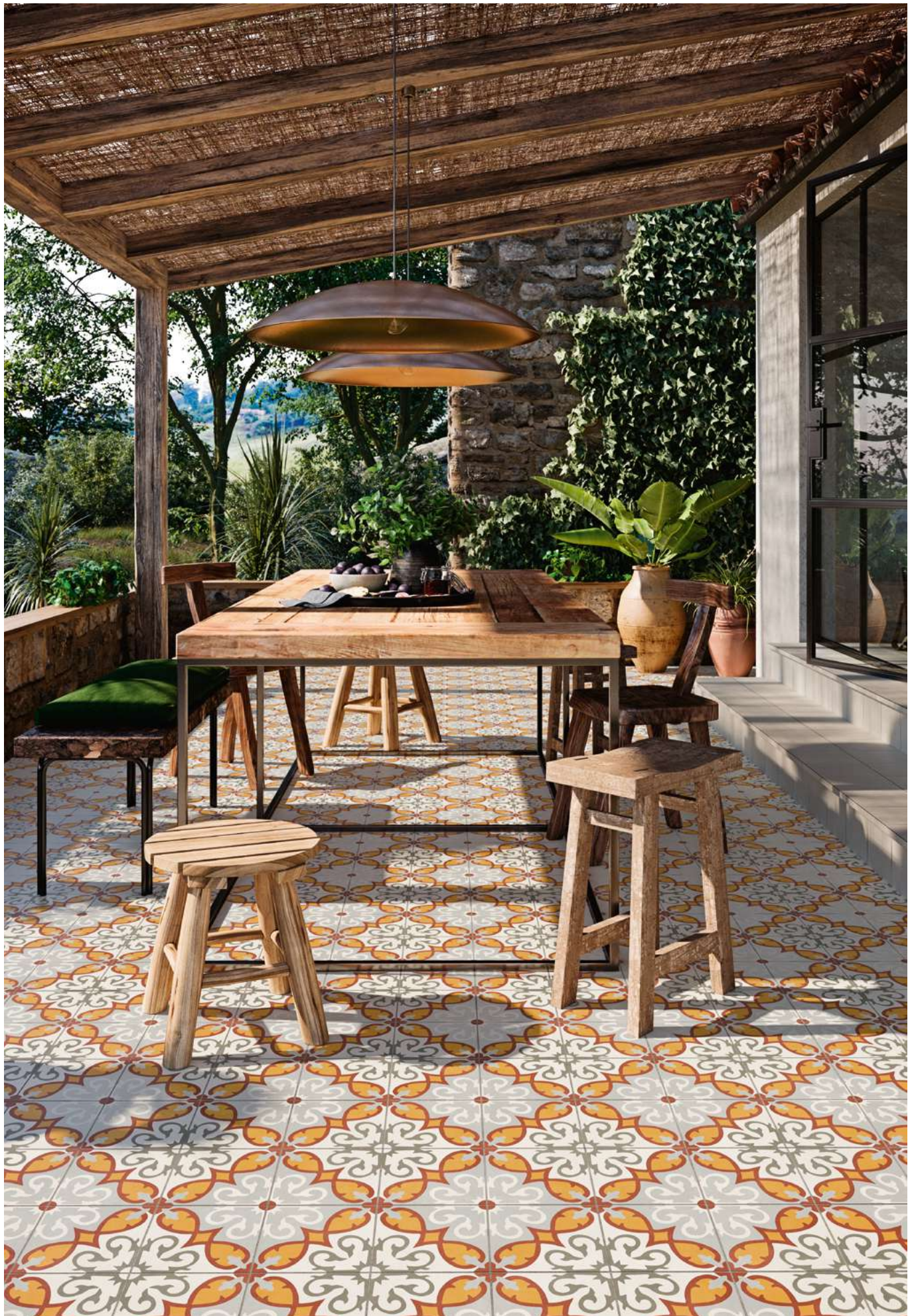
Floor: Altea Elda Outdoor 2CM 49,75x99,55 cm-Altea Puerto Outdoor 2CM Tipo L 100-Altea Puerto Natural 59,2x59,2 cm