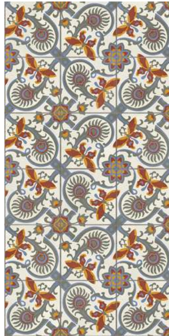
Altea Alba Outdoor 2CM 49,75x99,55 cm - 19,59"x39,19"