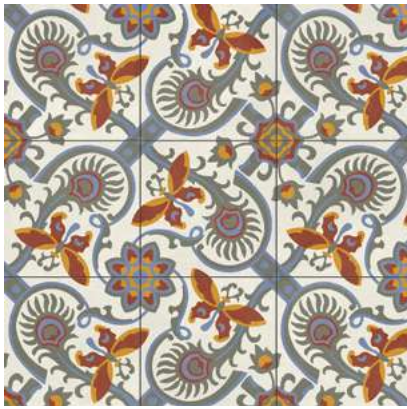
Altea Alba Natural 59,2x59,2 cm - 23,3"x23,3"