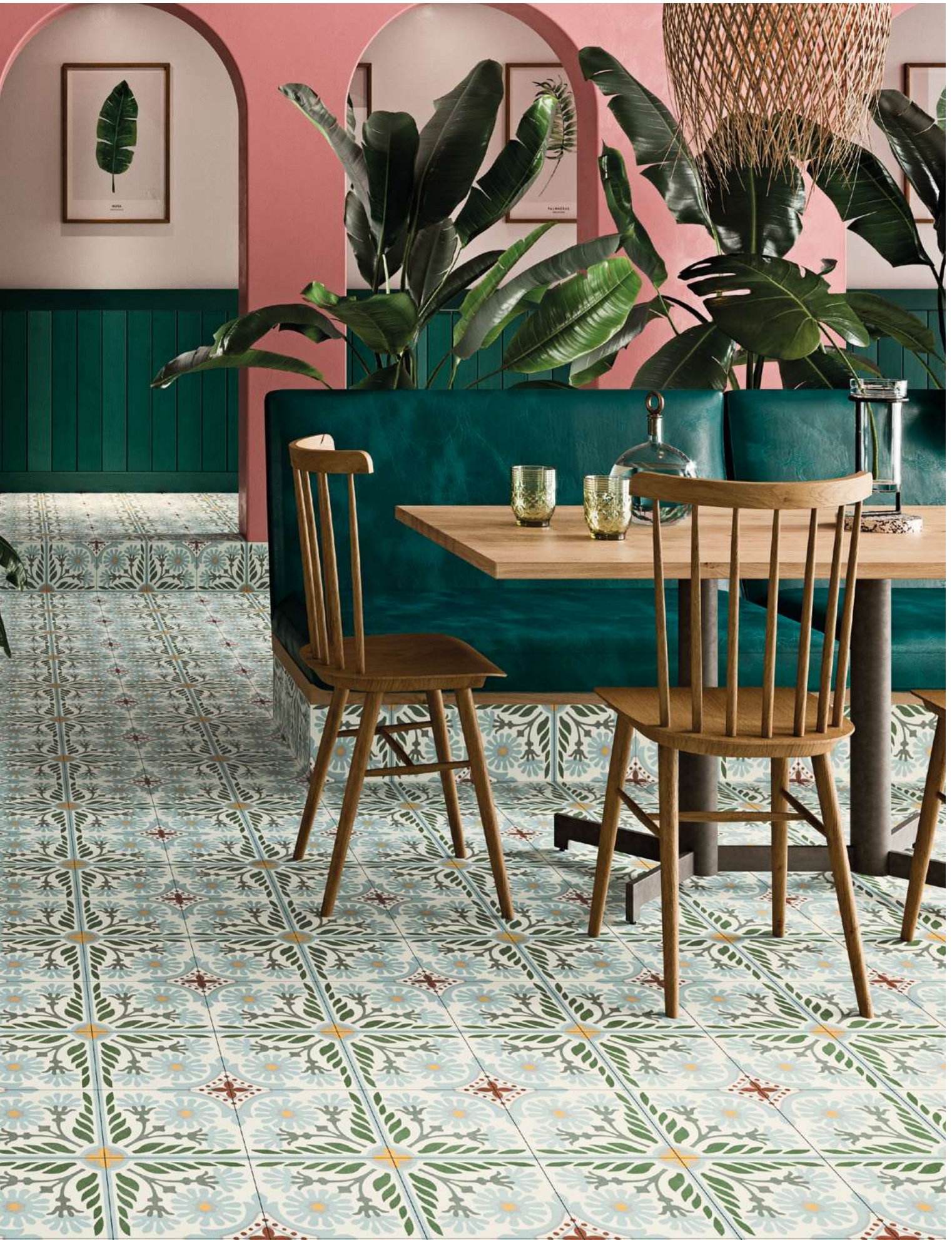
Floor: Altea Olivo Natural 59,2x59,2 cm