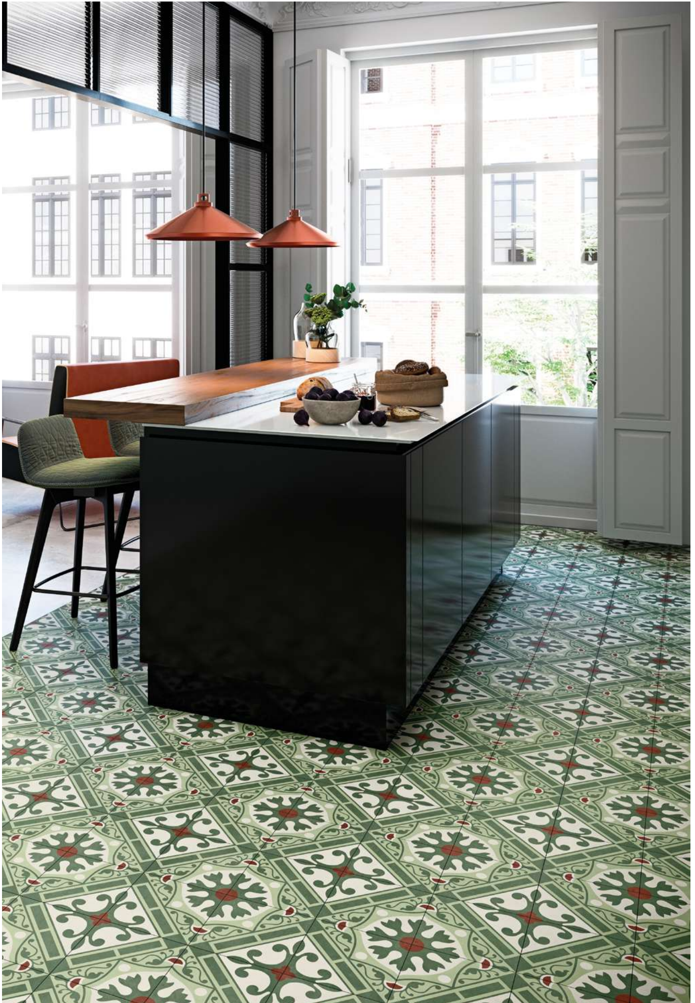
Floor: Altea Puerto_Corbeta Natural 59,2x59,2 cm